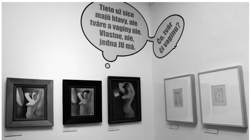
Pohľad do výstavy Holé baby: Necenzurované akty moderných majstrov

Eduard Manet v dvoch dielach cielenie využil efekt oblečeného diváka prichyteného pohľadom nahej ženy – Olympia a Raňajky a trvá vzbudili rozhorčenie práve pre tento detail – žena pozerá uprene a vôbec nie je v rozpakoch. Publikum bolo pobúrené, že je tak drzá! Navyše sa vymykala vtedajšiemu kánonu krásy – príliš biela a hranatá. (Olympia bola v Salóne vystavená zároveň s ľubým gyčovým aktom od Cabanela, znázorňujúcim nahú Venušu na vlách, s polozakrytú tvárou a privitymi očami. Týmto výjavom nebol pohoršený nikto a obraz si kúpil samotný panovník.)