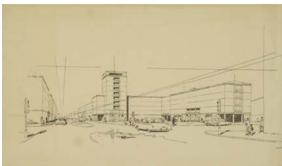
↑Návrh neidentifikovanej exteriéru Perspektíva. Nedatované