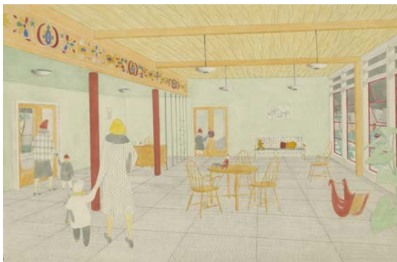
↑Návrh škôlky. Perspektíva interiéru Nedatované.