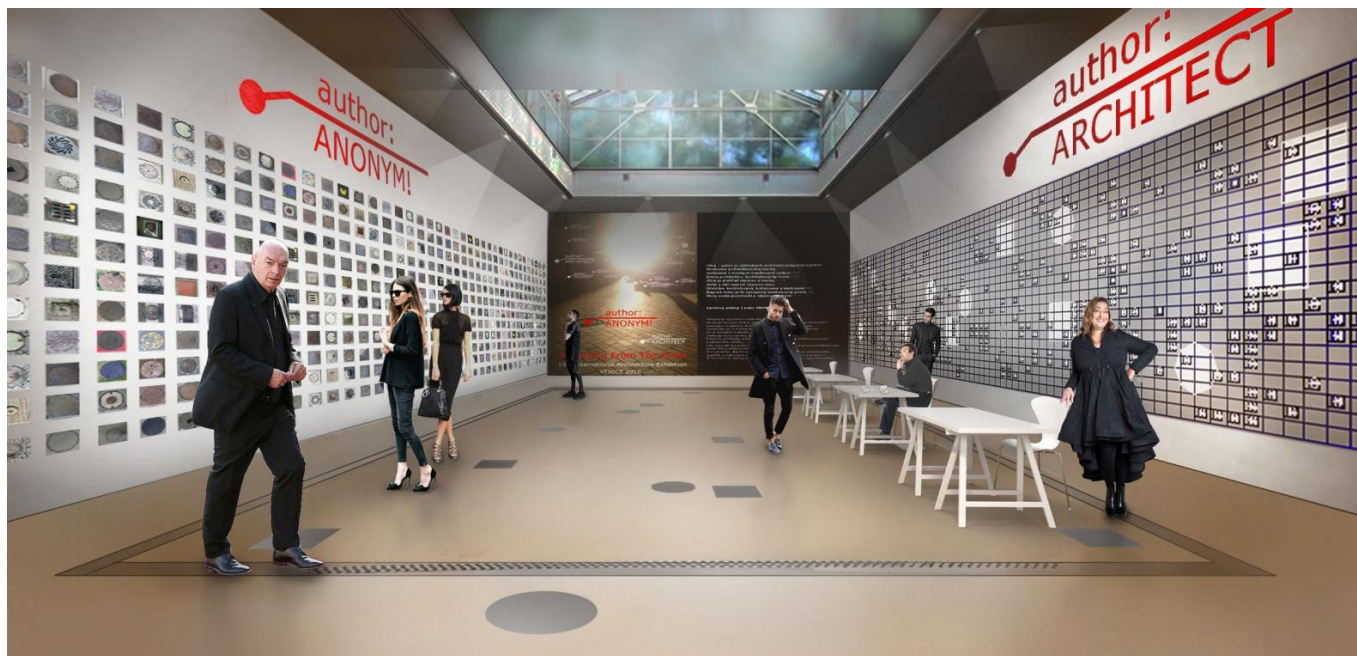
Vizualizácia inštalácie v pavilóne